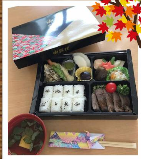
お楽しみ弁当 大淀園