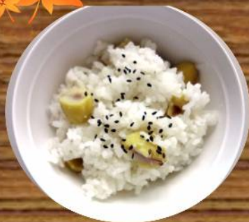
栗ご飯(重陽の節句)