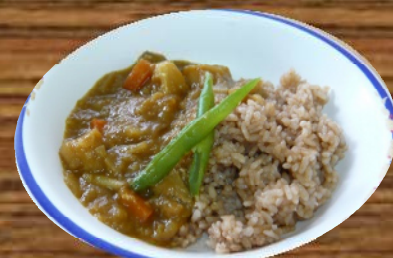
番茶カレー(日本茶の日)