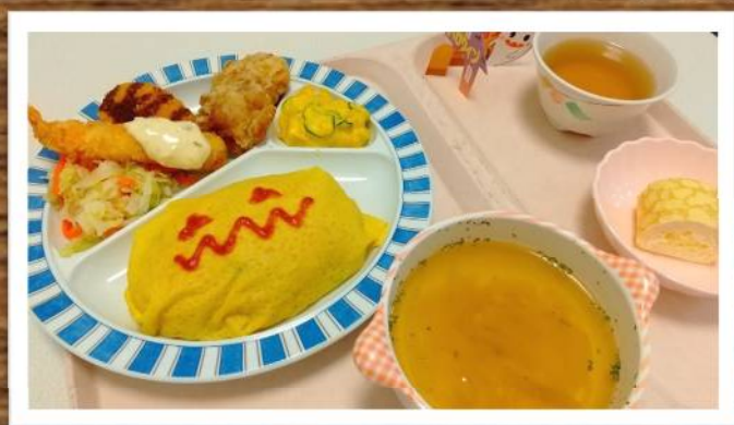
ハロウィン吉野学園