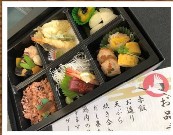
長寿式 特養寮・老人寮