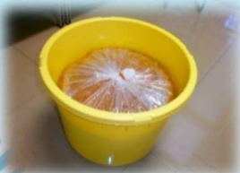
奈良県農業協同組合様より