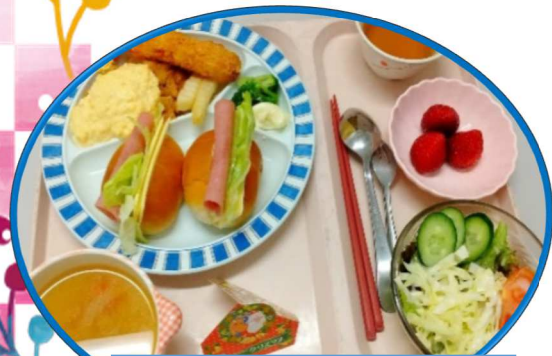
クリスマス 吉野学園