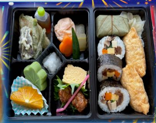
大淀園:6月のお楽しみ弁当