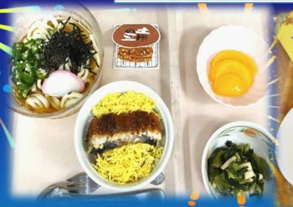
吉野学園:土用の丑の日