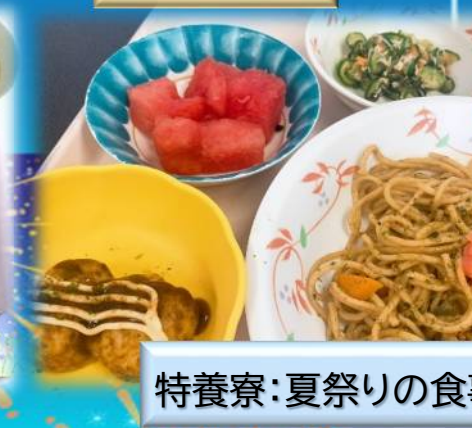
特養寮:夏祭りの食事