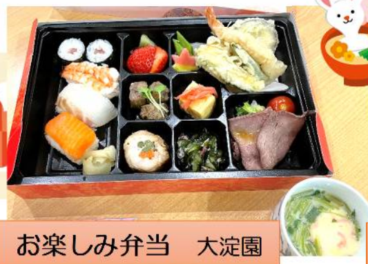
お楽しみ弁当 大淀園