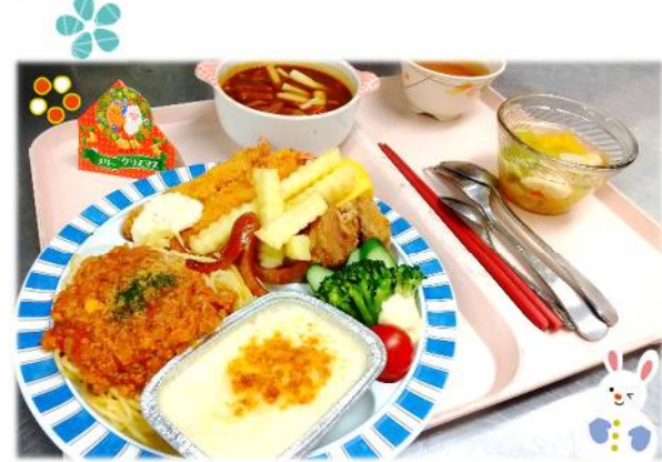
クリスマス 吉野学園