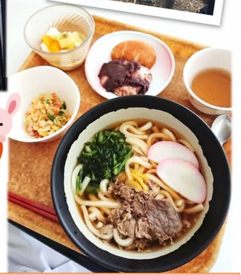
お餅・肉うどん 特養寮、老人寮