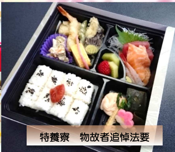
特養寮 物故者追悼法要