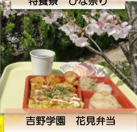
吉野学園 花見弁当