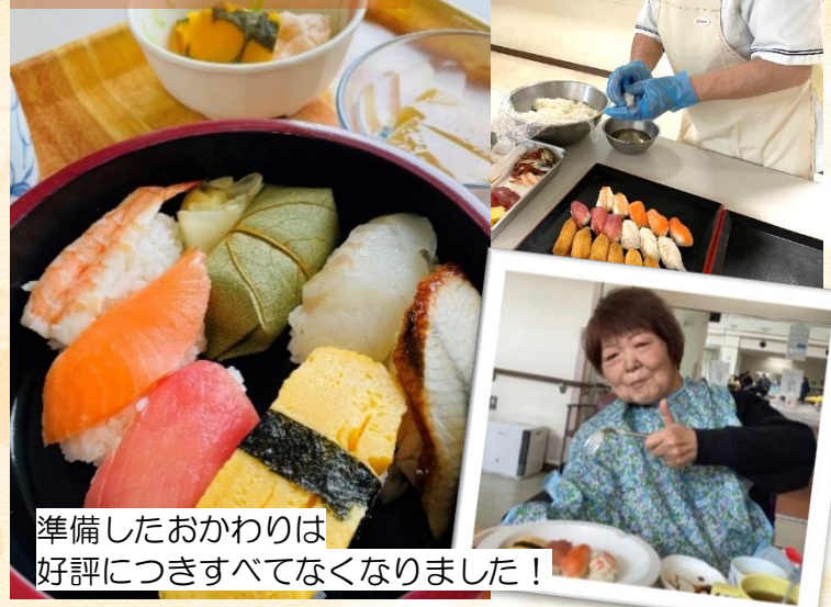
準備したおかわりは好評につきすべてなくなりました！