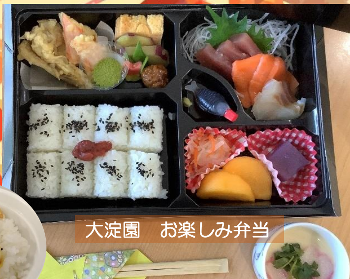
大淀園 お楽しみ弁当