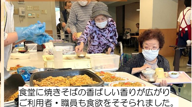
食堂に焼きそばの香ばしい香りが広がり ご利用者・職員も食欲をそそられました。