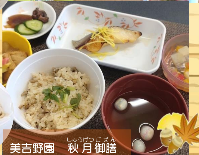
美吉野園 しゅうげつごぜん 秋月御膳