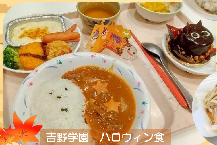
吉野学園 ハロウィン食