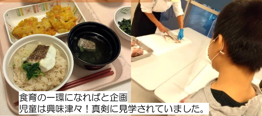
食育の一環になればと企画 児童は興味津々！真剣に見学されていました。