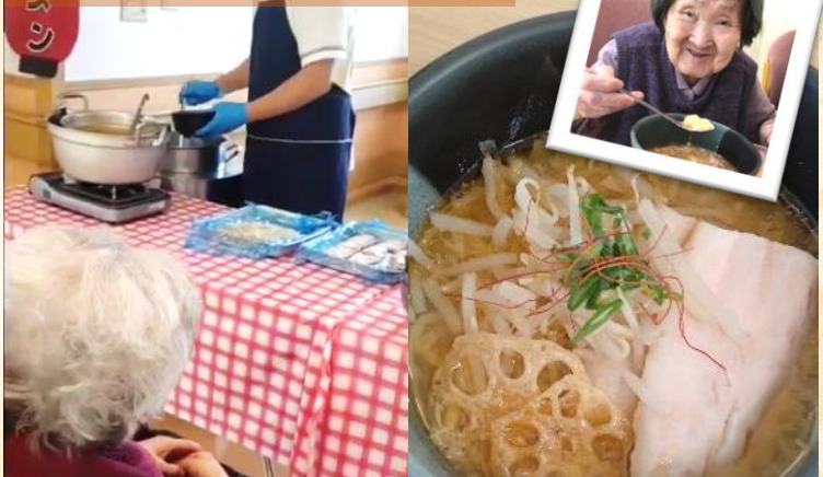
立ち上がる湯気を眺めながら、ラーメンを楽しみにされるご利用者。手作りのチャーシューも「美味しいっ！」と好評でした。