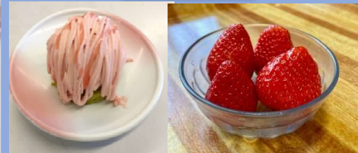
季節のデザート&フルーツ