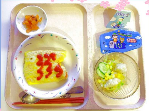
吉野学園 端午の節句