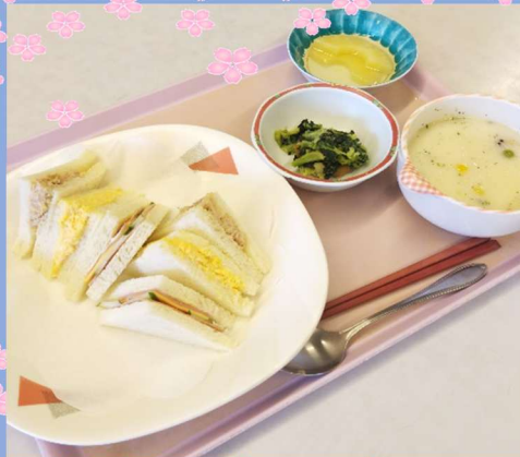
老人寮 選択メニュー