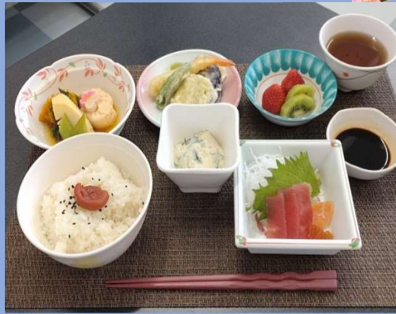
美吉野園 物故者追悼法要