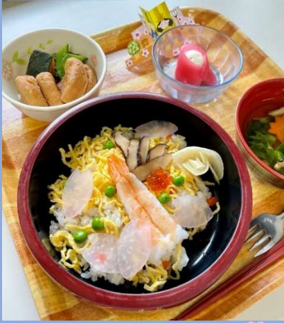
大淀園 ひなまつり