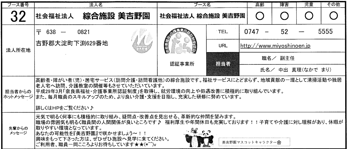
美吉野園マスコットキャラクター

▼▼▼記入見本です。必要項目を上書き入力し、保存してください。▼▼▼ ▼▼クリックしてプルダウン(リスト)メニューから選べる項目もあります。▼▼ ▼フォント(書体)・ポイントの大きさは、極力変更しないでください。▼